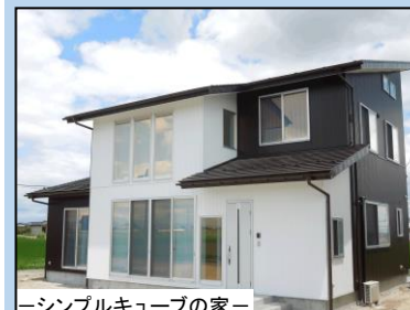
—シンプルキューブの家—