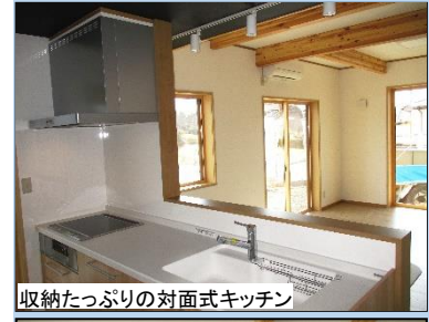
収納たっぷりの対面式キッチン