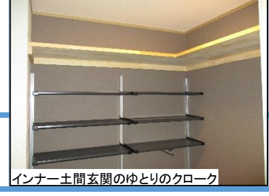
インナー土間玄関のゆとりのクローク