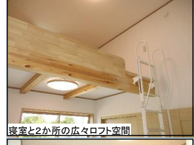
寝室と2か所の広々ロフト空間