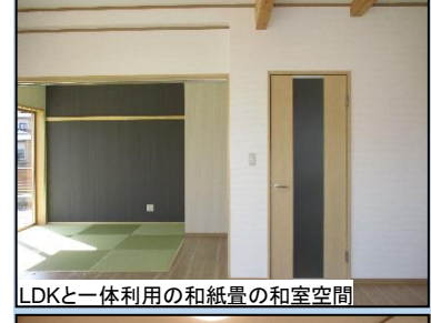
LDKと一体利用の和紙畳の和室空間