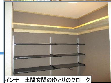
インナー土間玄関のゆとりのクローク