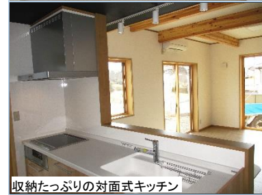
収納たっぷりの対面式キッチン