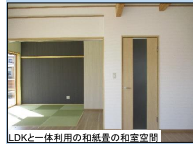
LDKと一体利用の和紙畳の和室空間