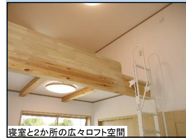
寝室と2か所の広々ロフト空間