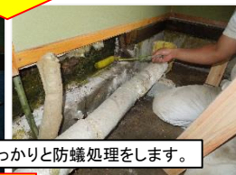
シロア리를駆除して、しっかりと防蟻処理をします。