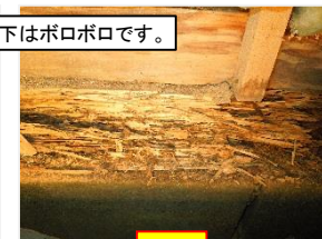
木材の下に大量のシロアリが！