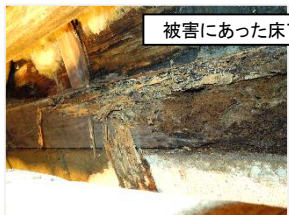
被害にあった床下はボロボロです。