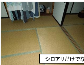
シロアリだけでなく耐震も安心です。