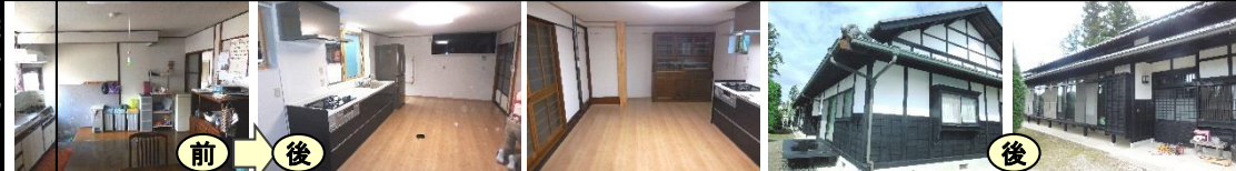
<キッチンリフォーム工事>