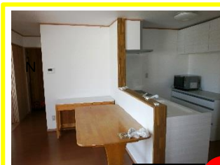
キッチン New その他水回り

トイレを水洗化に／断熱効果の高い浴室に／ 家族の笑顔が見える対面キッチンにしました。