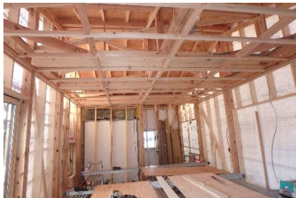
住宅離れ新築工事(古川現場) ▲11月完成を目指して ▼外装リニューアル工事竣工(岩出山現場)

現在進行中の現場は岩出山と古川。間もなく登米市中田の現場もスタートします。これからの季節、益々日も短くなって、降雪など天候の影響も心配です。普段以上に安全安心に心がけ工事を進めていきたいものです。