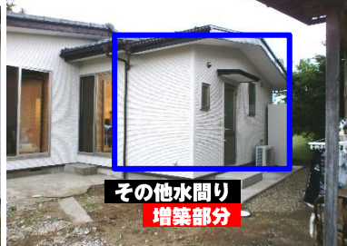
その他水回り 増築部分