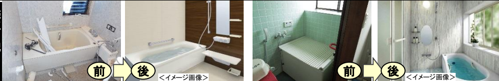
<浴室改修工事:それぞれあったか浴室に生まれ変わりました!!>